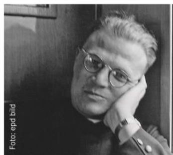
Alfred Delp in seiner Münchener Zeit um 1940.

1907 in Mannheim geboren und in einem gemischtkonfessionellen Elternhaus aufgewachsen, ließ Alfred Delp schon früh einen eigenen Kopf erkennen. Alfred ging in die evangelische Volksschule – und freundete sich innig mit dem katholischen Pfarrer an. Als Erzieher am Ordenskoleg entwickelte der junge Jesuit unkonventionelle Erziehungsmethoden. Bald nach seiner Priesterweihe 1937 ging der Männer- und Arbeiterseelsorger und Zeitschriftenredakteur Delp auf offene Konfrontation zu den Nationalsozialisten. Anders als viele christliche Regimegegner damals protestierte er nicht nur, wenn der eigene Besitzstand bedroht war, die Rechte der Kirche, die katholische Lehre. Er unterstützte und versteckte verfolgte Juden. Delp 1943 vor Männerseelsorgern in Fulda: „Was helfen uns alle Proteste und alle Einsätze um spezifisch christliche oder kirchliche Eigentümlichkeiten,